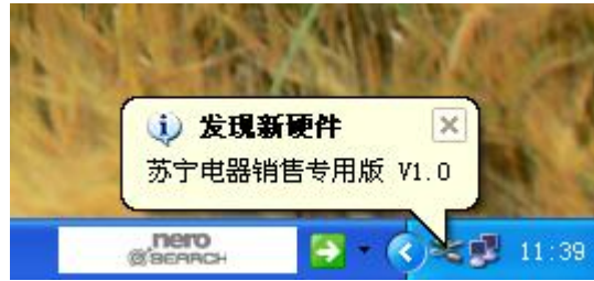
图 2-1 插入时显示信息