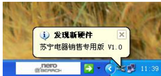
图 2-1 插入时显示信息